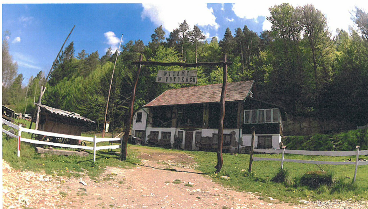
Prywatne muzeum "Potoki"

Przysiółek Wilczak posiada kaplice z XIX wieku na granicy Błazowa Górna - Białka - Lecka oraz prywatne muzeum "Potoki".