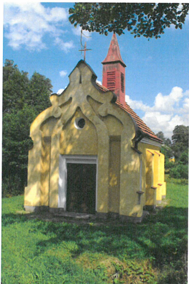
Kaplica na Wilczaku