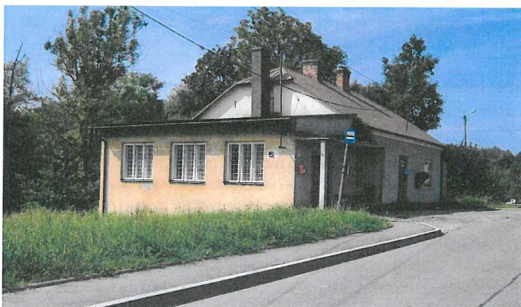
Świetlica wiejska po remoncie