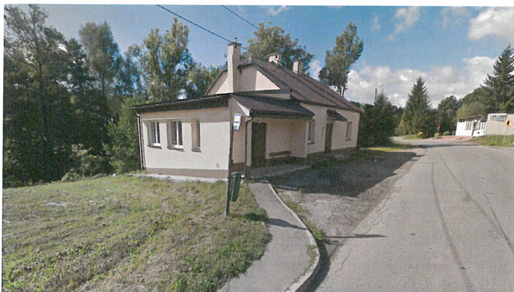
Świetlica wiejska przed remontem

Świetlica wiejska wybudowana w latach 60. XX wieku, w latach 90. powiększona o pomieszczenie zlewni mleka. Pomieszczenia te były bardzo skromne i wymagały gruntownego remontu. W roku 2011 obiekt ten został wyremontowany. Obecnie znajdują się tutaj dwie sale (mała i większa), zaplecze kuchenne i zaplecze sanitarne. Przed budynkiem znajduje się przystanek PKS-u oraz sklep. W miejscowości funkcjonowały dwie filie szkół. Obecnie nie funkcjonuje żadna z nich.